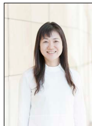
角田 光代 さん