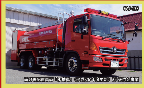
南分署配置車両「水槽車」(平成26年度更新) 25交付金事業